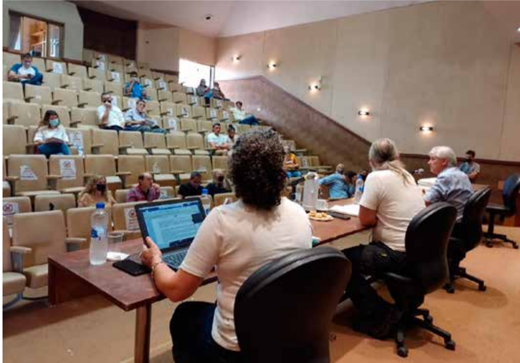
Martes 22 de marzo de 2022. Otro mojón en la vida del cuerpo colegiado universitario.

Se dejó de lado de lado la participación remota. Sin la mediación de las TIC, la reunión ordinaria se desarrolló este martes en el aula magna de la Facultad de Agronomía y Veterinaria