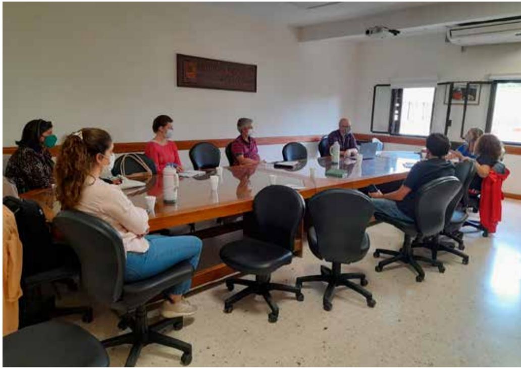
La sala Pereinta Pinto de rectorado fue escenario de una reunión organizativa del acontecimiento.

El objetivo es mirar “lo que se hace desde los cuatro claustros (docentes, nodocentes, graduados y estudiantes) y también de futuro: hacia dónde queremos ir, cómo seguimos en extensión”. Planteó Ducanto que se busca mejorar la extensión pues, si bien “la universidad siempre ha estado muy vinculada con el medio”, es menester desarrollar una relación más sistemática y coordinada, primero para